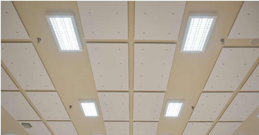
Paneles Cronatur 25 fijados al techo continuo mediante tornillería.