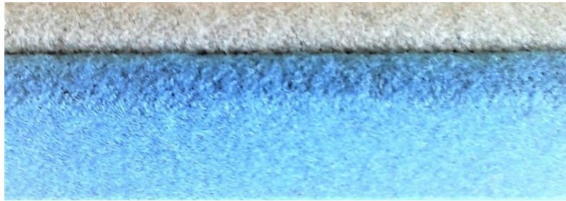
Detalle encuentro de los paneles.