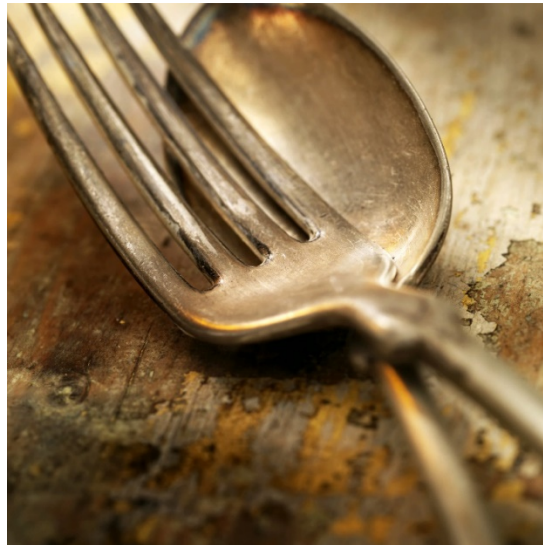
Restaurante Carmo, Madrid

Los paneles absorbentes y decorativos CROXON ARTE, impresos digitalmente, se crean combinando el diseño y unas excelentes propiedades acústicas.