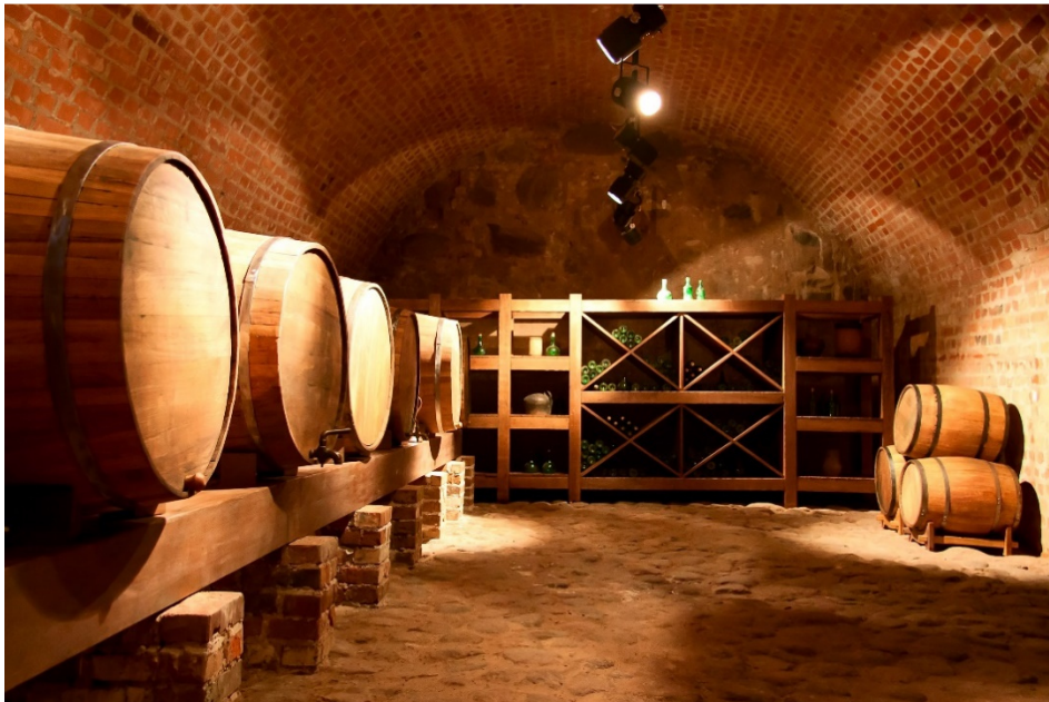
Panel Croxon Arte fabricado para Techos Calabuig, de Valencia

Todos los productos que conforman el panel son no inflamables y reciclables.