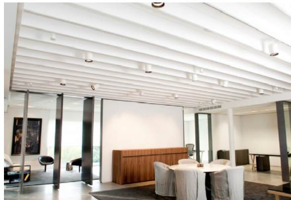
Instalación Croxon Baflox (Madrid)

Los baffles absorbentes CROXON BAFLOX son ideales para zonas donde la reverberación procedente de las superficies rígidas es un problema. Estos baffles están diseñados para suspenderlos en espacios abiertos y reducir el eco y los tiempos de reverberación que con frecuencia inundan los gimnasios, fábricas, aulas, cines, hoteles, polideportivos, salas de conferencias, piscinas, restaurantes, iglesias, etc.