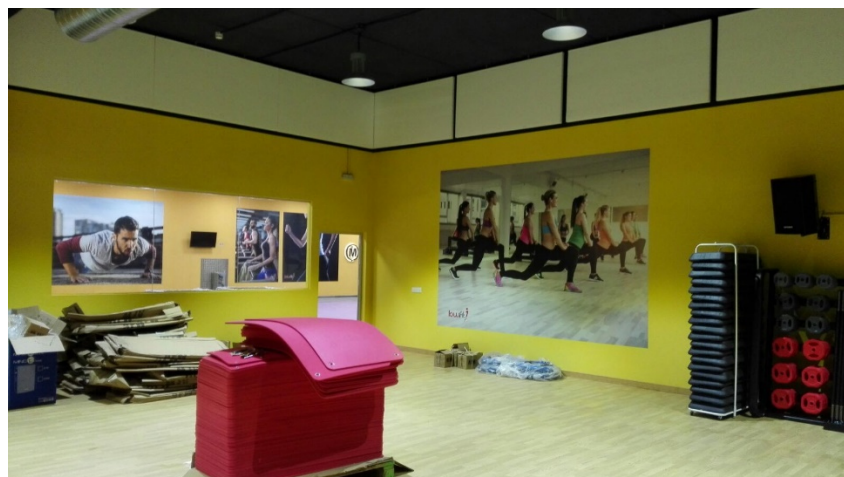
Instalación Croxon Baflox (50 x 1000 x 2000 mm) en gimnasio Sevilla.